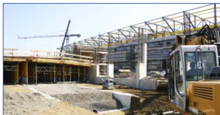
Bild rechts: Herstellung des flächigen GEO PROTECT®-Tragschichtspeichers unterhalb des Spielfeldes.

Bild links: Herstellung des GEO PROTECT®-Speichers mit zweilagiger Speichermineralienmischung unterhalb des Flächenbelages des Parkhauses.